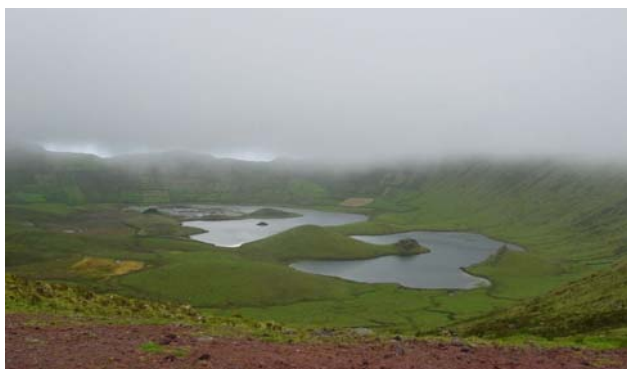
De vulkaankrater op Corvo

Op de hier weergegeven reis wordt Schamu'radhin vergezeld door een jonge Mercurius-ingewijde, Thamu'thamas ('Degene die anderen toevertrouwd, wat hij van God ontvangen heeft'), die voor de eerste maal een dergelijke reis meemaakt. En hij beleefd nu een groot wonder: De meeste Atlantiërs hebben nog nooit de zon, de planeten en de sterren, de blauwe hemel gezien. Boven de Zonne-vulkaan met de heilige naam Xandorra'tauwa ('God's gezegende Zonne-plaats'), stromen echter continu hete gassen uit en maken de lucht erboven open. Bij het opstijgen van de Gamamila tot de Vulkaanrand ziet de jonge Thamu'thamas zo voor de eerste maal de blauwe hemel en de zon. Aanvankelijk is deze ervaring voor hem nog te intens. Speciaal daarvoor heeft hij een rendiergewei meegebracht, waarop een dun gespannen vissehuid is bevestigd; daarmee kan hij zich beschermen. Wegzwenkend van de vulkaanrand gaat de tocht omlaag naar het Zonne-orakel in het binnenste van dit oord, gevormd door bergformaties met de 'zonnetrap' in het midden, met vijvers, kanalen, plantages en twaalf verschillende werkplaatsen, die rondom de gehele bergrand verdeeld zijn.