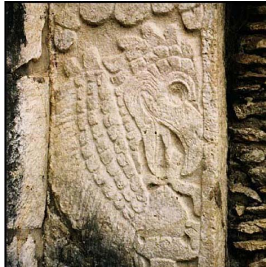
Adelaar eet mensenhart (Reliëf op een Maya Tempel in Chichen Itza)

onder invloed van krachten, die hem ook daar alleen als een wezen deden verschijnen, dat puur gericht is op de aardszintuiglijke verhoudingen.“