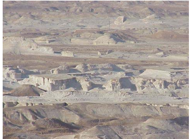
Het desolate gebied rond de Dode Zee wordt vermeld als de plek waar Sodom en Gomorra hebben gelegen

Dat dan een evenwicht binnen de ziel tussen het (vogelachtige) denken, het (leeuwachtige) voelen en het (stierachtige) willen bewerkstelligd werd, zoals het in de sfinx-gestalte tot uitdrukking komt, een evenwicht, dat tot grondslag voor het denken kon worden, dát was het gevolg van het tweede offer.