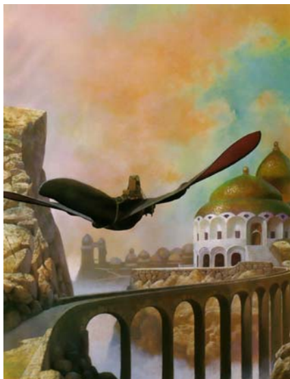
Werk van de striptekenaar Vicente Segrelles

Alles wat de Atlantiërs ontwikkelden: bouwwerken, wegen, techniek, kunst en taal; dit alles was geschikt om ze meer en meer boven de dierlijke levensvormen te verheffen. Zij leefden in groepen en beleefden zich, net als de dieren, als behorend tot groepszielen. Menselijke groepszielen zijn nu een fenomeen dat juist ook door Hobbs indrukwekkend wordt beschreven. Ik meen daarom, dat haar ,fantasie', net zoals Moenin Nederlander het voor de boeken van Tolkien aanneemt, feitelijk tot in Atlantis teruggaat.