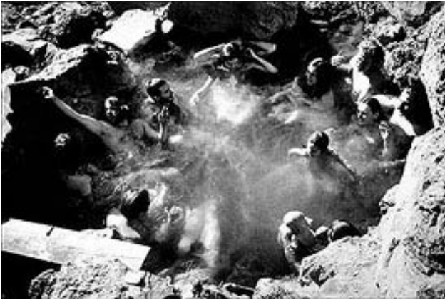
VS, 1967: 10 hippies bij elkaar in bad! Wat een morele anarchie toch, die jaren '60.

We hebben hier te maken met een directe aanval op de individuele menselijke creativiteit en daarmee het scheppende vermogen van onze samenleving. Het is hoog tijd om op te komen voor het recht van mensen om zelf hun leven vorm te geven: daaruit ontstaan heel andere gemeenschappen dan de huidige beleidsmakers zich kunnen voorstellen.