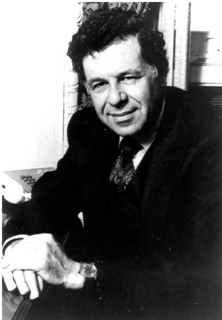
Amitai Etzioni, medio jaren '80

Begin 2004 keek ik naar 'De waardenfluisteraar' , een documentaire van het VPRO programma Tegenlicht. 1 Daarin werd de invloed van het communitaristische gedachtegoed van Amitai Etzioni op Balkenende getoond. Volgens deze joodse socioloog moet niet de overheid, maar de gemeenschap de norm bepalen in een samenleving; dat wat men déélt met elkaar, wordt het morele uitgangspunt. De werkvorm daarvoor is de dialoog. Zijn kernwoorden vormen een mooi plaatje; gemeenschappen, zoeken naar wat je deelt, de dialoog aangaan.