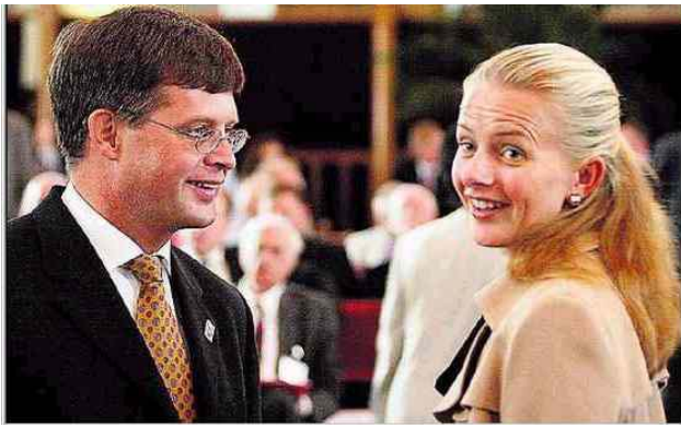
Den Haag, 7 september 2004

Waarom grijpt hij terug op algemene regels die de mens moreel moeten leiden? Het logische antwoord hierop is dat Etzioni de mens niet in- en vanuit zichzelf als moreel wezen ziet, laat staan als een wezen dat uit zichzelf scheppend met anderen tot een morele gemeenschap kan komen. 9 In lijn hiermee is te zien hoe in zijn voorbeelden tal van op zichzelf prima morele handelingen meteen als algemeen geldend en vaststaand neergezet worden. Het worden regels waar ieder mens zich naar moet voegen. Je geeft donaties aan een goed doel omdat 'een goed mens dat doet'.