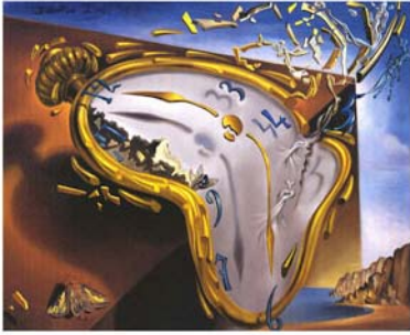
Salvador Dali, 'Soft Watch'