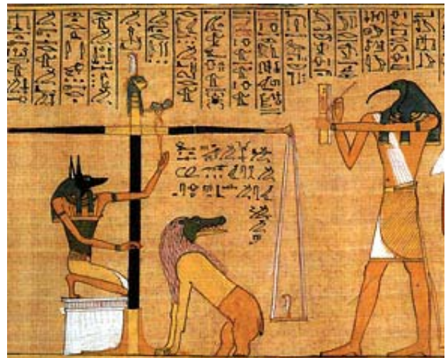
Oud-Egyptische afbeelding: de zojuist gestorven ziel wordt gewogen. Anubis, de bewaker van de dodenwereld, kijkt of de gestorven ziel het evenwicht bewaard, Thoth registreert de resultaten, Ammit staat te wachten op zijn kans om zondige harten op te eten

Waar men met zijn hart is, is innerlijke nabijheid, wat als een gevoelsmatig concentreren werkt.