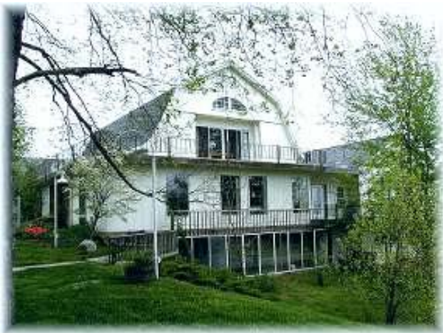
Lily Hill Farm

Toen we de boerderij kochten en van Ernie, één van de burens, begonnen te leren hoe we met de druiven moesten omgaan, was ik geschokt door de hoeveelheid sterke pesticiden die we op de wijnranken moesten spuiten om onkruid of schimmels de baas te blijven of ongedierte in het nauw te drijven. De bestrijdingsmiddelen waren zo krachtig dat we het huis in moesten en ramen en deuren moesten sluiten terwijl er gespoten werd. Wanneer dat klaar was, was het advies om in de twee dagen erna maar beter niet door de wijngaarden lopen. Ik had me nog nooit afgevraagd of het ook anders zou kunnen, omdat ik nooit echt serieus over de wijngaarden had nagedacht; maar nu kwam het hele idee van het rondspuiten van vergif me totaal idioot voor. Ik richtte mij tot de elven, zowaar op nuchtere wijze: “Wat moeten we doen om deze druiven te verbouwen zonder maar overal bestrijdingsmiddelen in het rond te spuiten? Kunnen jullie helpen om ze resistent te maken? Is een opbrengst van 8 à 10 ton per akker per jaar mogelijk?” (Akker is een losse vertaling van de Engelse landmaat acre: een slag kleiner dan een voetbalveld. Acre= 4046,86 m 2 Hectare=10.000m 2 (100 bij 100) Red.)