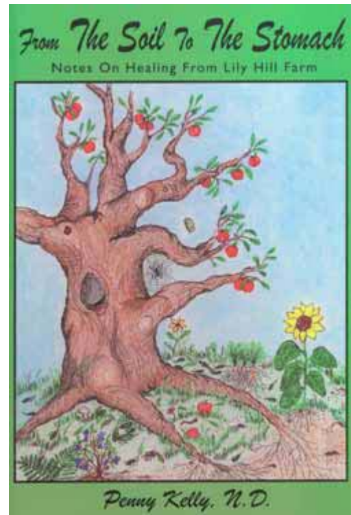
From the soil to the stomach, notes on healing from Lily Hill Farm, 2003

Bomvol zinnige opmerkingen: aan we ook ergens in 2006 een paar stukken uit vertalen)