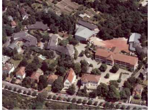
De eerste Waldorfschool (rechterdeel) met tal van uitbreidingen

MN: Steiner sprak er in zijn laatste jaren over dat de antroposofen van de eerste generatie alleen de ‘voorbereiders’ zouden zijn voor datgene, wat dan als spiritualiteit ook andere, nog niet geïncarneerde individuen mee zouden brengen. In de kern heb je deze vraag eigenlijk door het zojuist gezegde beantwoord. Echter toch nog even heel direct: Heb je de indruk dat de door Steiner als noodzakelijk voor de aardcultuur geachte ‘culminatie’ van de spirituele impuls plaatsgevonden heeft, of heb je eerder de indruk van een spirituele neergang, gemeten naar wat in de eerste decennia als aanzet gegeven is?