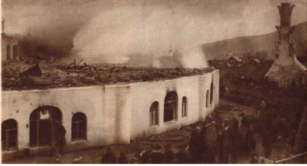
Het eerste Goetheanum na de brand, oudejaarsnacht 1922