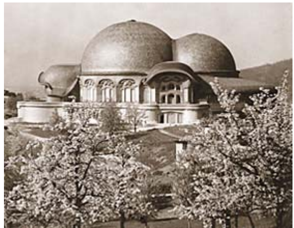
Het eerste Goetheanum

CF: De herinnering aan de ontmoeting met Rudolf Steiner behoorde voor mij tot de eerste ervaringen op dit gebied en kwam voor mij als een volslagen verrassing, maar met een schokkende duidelijkheid. Normaal gesproken heb ik bij de herinneringsbeelden eerder bleke of onduidelijke indrukken, maar Rudolf Steiner stond bijna fysiek voor me. Hij was ongelooflijk ernstig en sprak met grote zorg over de toestanden binnen de vereniging. De scene vond plaats in Dornach in de buitenlucht, met een kleine groep mensen die elkaar daar waarschijnlijk toevallig getroffen hadden. Het eerste Goetheanum was er nog. De exacte inhoud van het gesprek kon ik niet waarnemen, alleen de stemming, die enorm bedrukt was. Ik had de indruk, dat Rudolf Steiner een dringend beroep deed op alle aanwezigen om te doen wat nu noodzakelijk was. Ik beleefde dat als een opdracht en wist op hetzelfde moment – dus met mijn huidige bewustzijn in de herinnering- dat ik die niet vervuld had. Tegelijkertijd werd me duidelijk dat ik in Dornach slechts op bezoek was en de opdracht op een andere plaats betrekking had. Toen dook de school in Stuttgart op; ik zag mezelf in een klaslokaal jonge kinderen onderrichten, ongeveer de 3 e /4 e klas. En er verscheen een scene met Rudolf Steiner, hoe hij me op het schoolplein ontmoette en me aanmoedigde zo verder te gaan. – Later breidden deze eerste indrukken zich uit door verder onderzoek.