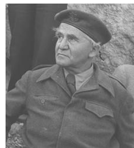
David Ben Goerion (1884-1973) Eerste premier van Israël ('48-'53 en '55-'63)

De revisionistische bezwaren tegen de onderhandelingen van Arlosoroff met de nazi's stonden niet op zich. Later in 1933 leidde dit thema tot een heftige confrontatie tussen de WZO en de revisionisten tijdens het 18e zionistische congres te Praag. Wladimir Jabotinsky sprak zich uit tegen collaboratie met het nationaal-socialisme. Maar door de moord op Arlosoroff waren hij en zijn in het bruin gehulde Betarim niet populair bij de meeste zionisten. Hij kreeg daarom niet veel stemmen achter zich, met als gevolg dat het voorstel tot nadere samenwerking met de nazi's het haalde.