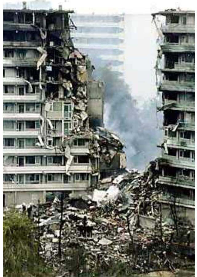
Pas zes jaar na de Bijlmer-ramp werd duidelijk dat de El Al Boeing minstens 240 kilo grondstof voor Sarin vervoerde. De verantwoordelijkheid van het IIBR bleef onderbelicht in de parlementaire enquête.