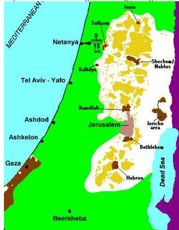
De Palestijnse autonomie volgens de Oslo akkoorden. Donkerbruin: gebieden met Palestijns zelfbestuur. Geel: Palestijns bestuur, Israëliische ordehandhaving. Wit: Joodse nederzettingen en doorgangswegen.

niet in aanmerking als afzetgebied. Bovendien produceerden landen als Jordanië en Egypte hun eigen groenten. Daardoor bleef alleen Israël (dat zich toelegt op exclusieve landbouwproducten) over als afzetgebied. Ook de exportmogelijkheden van textielproducten uit de Palestijnse gebieden waren beperkt. Omdat Israël de Palestijnen verbood zelf eindproducten te fabriceren, bleef de joodse staat ook in dit geval als enige afzetgebied over.