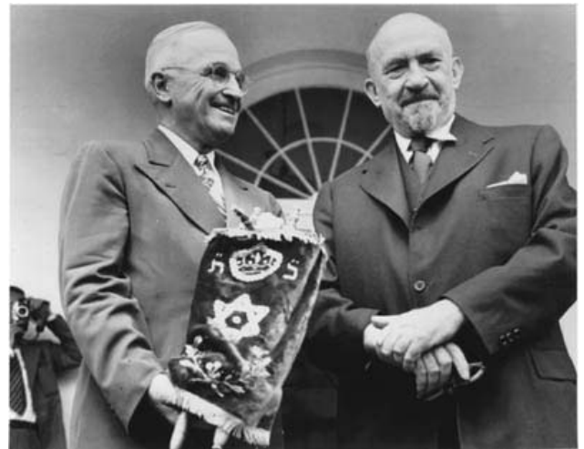
President VS Harry Truman (links) erkende de staat Israël binnen 11 minuten na de proclamatie in 1948 door Chaim Weizmann (1874-1952), die Israël's eerste president werd.

"Als ik zou weten dat het mogelijk zou zijn om alle kinderen in Duitsland te redden door hen naar Engeland te brengen; en alleen de helft door hen naar Israël te brengen, dan zou ik voor de tweede mogelijkheid kiezen. Want wij moeten niet alleen het leven van deze kinderen in overweging nemen, maar ook de geschiedenis van het volk van Israël."