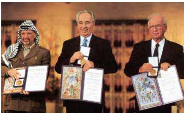
Winnaars Nobelprijs voor de Vrede 1994: Arafat, Peres, Rabin

Tekenend voor de situatie was dat in Israël geen kritiek hoorbaar was op deze maatregel. Verder drong Rabin aan op een totale controle van de Palestijnse media. Aldus was het mogelijk de Palestijnen bezig te houden met relatief onbelangrijke kwesties, terwijl de zaken waar het om draaide, onbesproken bleven.