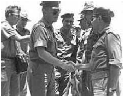
Rabin als Commandant in de Zesdaagse Oorlog in 1967

Palmach waren volgelingen van Yitzhak Tabenkin, de leider van Le' ahdut Ha'a-voda. Deze organisatie streefde na het ontstaan van Israël naar gebieds-uitbreiding en had veel invloed op linkse zionisten. Als Palmachcommandant was Rabin verantwoordelijk voor het opblazen van huizen in Palestijnse dorpen, zoals in Bidu, Bet en Surik. In 1967 was Rabin bevelhebber van de Israëlische strijdkrachten tijdens de historische overwinning van Israël in de Zesdaagse Oorlog. Volgens de Israëlische publicist Israël Shahak had Rabin op zichzelf niet zoveel met deze overwinning te maken. Maar dat nam niet weg dat hij de held van de joodse lobby in de VS werd, toen hij enige tijd later als Israëlisch ambassadeur naar Washington kwam. Met de winst van 1967 ontstond de vraag hoe Israël de Arabische bevolking in de nieuw bezette gebieden voortaan moest controleren. Volgens Rabin deed de joodse staat er verkeerd aan om met een groot aantal soldaten tot een 'conquest from the inside' te komen. Dit was volgens hem verre van doeltreffend. In plaats daarvan zag hij meer in een 'domination from the outside'. Hij stelde voor dat joodse nederzettingen en het Israëlische leger de Palestijnse dorpen en steden zouden omsingelen, waarbij hij de directe controle over de bevolking wilde overlaten aan de Palestijnse autoriteiten.