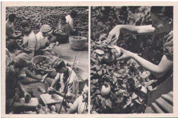
Sinaasappelteelt door joodse kolonisten in Palestina, jaren '30