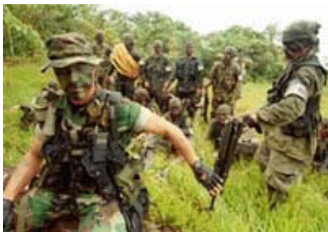
Colombia: rechtse paramilitaire eenheden

Over Israëlische wapenleveranties aan Arabische landen zijn er ook berichten uit België. In 1995 onthulde de voormalige Belgische rijkswachter Jean Bultot tijdens een tv-programma dat Israël gedurende de jaren tachtig wapens naar Arabische landen exporteerde via België en Zuid-Amerika. Uiteindelijk kwamen de wapens bij hun Arabische afnemers terecht. Het zou goed kunnen dat een deel van deze Israëlische wapens bij dergelijke transporten in Zuid-Amerika achterbleef. Want toen in 1990 een inval plaatsvond bij de Colombiaanse cocaïnebaron José Gonzalo Rodríguez Cacha, trof de politie daar een compleet wapenarsenaal aan afkomstig uit Israël. De wapenleveranties aan Colombiaanse drugsbaronnen gingen vergezeld met de komst van Israëlische instructeurs, doorgaans officieren buiten dienst van het Israëlische leger. Samen met Britse, Duitse en Noord-Amerikaanse collega's gaven zij in Colombia onderricht aan de moordenaars in dienst van de drugsbaronnen. Een rapport van de Colombiaanse geheime dienst hield de door Israëliërs getrainde doodseskaders verantwoordelijk voor het vermoorden van plattelandsarbeiders en linkse politici.