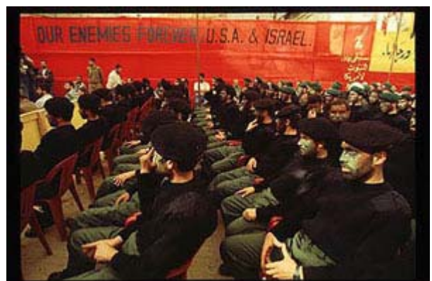
Hezbollah bijeenkomst in Libanon

Kennelijk is de Israëlische machtselite er veel aan gelegen de handel met Iran exclusief te houden. Dit schizofrene beleid dient in ieder geval niet de bij de Israëlische leiders zo hoog in het vaandel staande veiligheid. De door Israël aan Iran geleverde wapens vonden voor een deel hun weg naar de pro-Iraanse Hezbollah in Libanon. En deze fundamentalistische moslimorganisatie gebruikte ze vervolgens tegen Israëlische militairen en burgers!