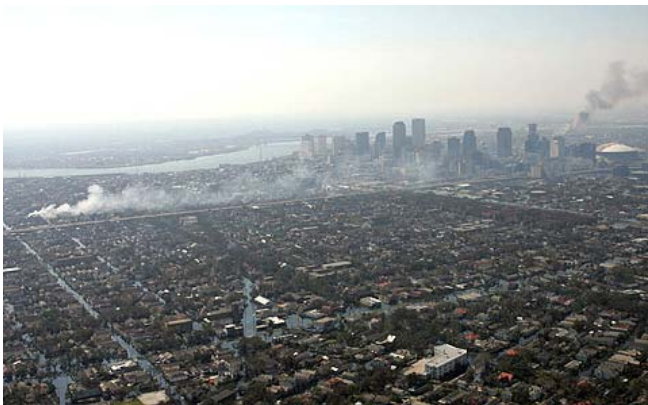
New Orleans, 6 september: een week na Katrina

2. De natuur staat definitief op de agenda. Zij is uit balans en dat veroorzaakt wereldwijd de ene ramp na de andere. Wie wil dat nu nog ontkennen?