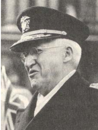
Admiraal Harold Stark

een klein proefstation op precies de goede plek staan. 1 De torpedonetten werden door Kimmel direct bij zijn aantreden besteld, twee netten lagen bij de ingang van de haven (wat niet voldoende was). Luchtdoelgeschut kreeg hij beperkt toegewezen. Jachtvliegtuigen waren wel beschikbaar, al was nooit duidelijk hoeveel er permanent op Hawaï gestationeerd zouden blijven.