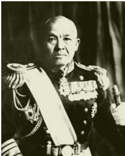
Admiraal Nagumo, commandant van de Hawaii-vloot

Daarnaast was er nog een veelbelovend geheim wapen in handen van de Britten: radar. Bij de (lucht)slag om Engeland kwamen Britse vliegtuigen altijd op tijd in de lucht door een keten van radarstations aan de Britse kust.