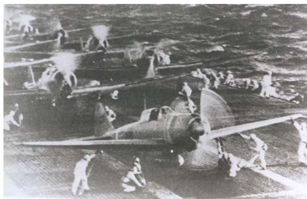
De eerste aanvalsgolf op het moment van vertrek, 300 km ten noorden van Hawai

Vervolgens was Marshall een half uur bezig de papieren te bestuderen. De koerier kon dit niet aanzien en interrumpeerde verschillende malen om op de 13.00 deadline te wijzen. Marshall trok zich er niets van aan. Om 11.45 was hij klaar en schreef een waarschuwing aan de legercommandanten in de Pacific. Hij belde met Stark, die erop aandrong de marinecommandanten ook afzonderlijk te informeren. Ook bood hij aan de krachtige radiostations van de marine te gebruiken om marine én leger te alarmeren. Marshall wimpelde dit voorstel af. 24