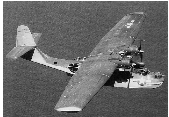
PBV Catalina van de Amerikaanse marine; bij uitstek geschikt voor de lange afstandspatrouille

Het is echter niet onmogelijk om jezelf te verplaatsen in de militaire overwegingen die ongetwijfeld een rol hebben gespeeld. Iedere militair had rekening te houden met een Japanse aanval vanaf september 1941. Bekeek men dit uitsluitend vanuit direct Amerikaanse militaire belangen, dan waren de Filippijnen en Hawaï de hoofddoelen. Een aanval op deze hoofddoelen kwam hoe dan ook vanuit zee met steun van vliegdekschepen. Luchtaanvallen zouden vrijwel zeker onderdeel uitmaken van de operaties. Vanuit mijn eigen optiek, sprongen twee vragen er bij de defensieve voorbereidingen uit. De eerste was hoe voldoende vliegtuigen op tijd in de lucht te krijgen om zich in de hangars en op de landingsbanen niet te laten overrompelen door de vijandelijke luchtmacht. 2 De andere vraag was hoe je de gigantische vloot die bij een dergelijke aanval op je af kwam een zo effectief mogelijke slag zou kunnen toebrengen.