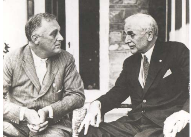
Roosevelt en minister van Buitenlandse Zaken Cordell Hull

in de eerste 10 dagen van december zou uitbreken. 12