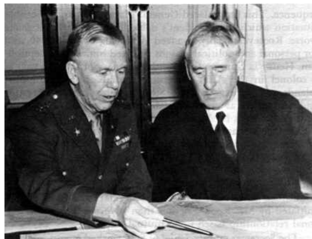
George Marshall en Minister van Oorlog Henry Stimson

codering nog steeds onbekend is. 21 'Dag X' was daarentegen in purpercode, maar....werd pas gedecodeerd ná de aanval. 22 De formele lezing is dat het leger acht dagen nodig had voor decodering. Dit gold in elk geval niet voor de onderschepping van de instructies vanuit Tokio aan de ambassadeur in Washington die, in 4 delen verspreid over 24 uur, op 6 en 7 december binnenkwamen. (Let hierbij op dat in Hawaii de dag ruwweg vijfenhalf uur later begint dan in Washington)