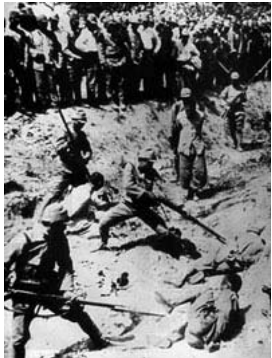
Nanking 1937: burgers worden gebruikt als levend oefenmateriaal voor bajonettraining

Voor Groot-Brittannië en Frankrijk was de onverwachte samenwerking tussen Hitler en Japan verontrustend. Frankrijk had nu in het geval van een oorlog met Duitsland niet alleen rekening te houden met een gevecht aan de eigen grenzen, maar eventueel ook in Frans Indo-China (het huidige Cambodja, Laos en Vietnam). Groot-Brittannië bleek opeens veel kwetsbaarder te zijn dan ze op grond van haar eilandpositie in Europa tot nog toe dacht. De Britse koloniën Maleisië, Hongkong en Singapore moesten opeens in het beleid richting nazi-Duitsland meegewogen worden. 9