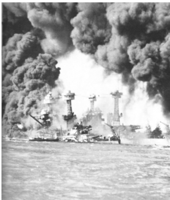
7 december 1941: de USS West Virginia en USS Tennessee zijn zwaar getroffen

In de vroege ochtend van zondag 7 december 1941 viel Japan de hoofdbasis van de Amerikaanse vloot in de Stille Oceaan aan. Er vielen 2200 doden en een aanzienlijk aantal schepen werd tot zinken gebracht. Tot Pearl Harbor was een grote meerderheid van de Amerikaanse bevolking tegen oorlogsdeelname geweest, maar met de verontwaardiging over de verrassingsaanval sloeg de stemming om. Door de oorlogsverklaring van Hitler en Mussolini aan de VS op 10 december, hoefde men niet eens meer te debatteren over het beperken van de oorlog tot Azië. Met het toetreden van de VS tot de strijdende partijen, vormt Pearl Harbor het grote keerpunt in de Tweede Wereldoorlog.