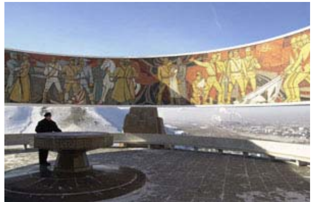
Monument in Noordoost-Mongolië ter herdenking van de slag bij de Khalkin Gul rivier tussen Russen en Japanners in 1939

Een belangrijke gebeurtenis ontsnapte echter aan de aandacht. In juli 1938 vond een veldslag plaats aan de Russisch-Koreaanse grens omdat de Russen een voor de Japanners omstreden gebied waren binnengekomen. De Russen leden de meeste verliezen, maar slaagden erin hun positie te heroveren. In mei 1939 ontstond een nieuw conflict, ditmaal bij de grens tussen Rusland, de Sovjet vazalstaat Mongolië, en Mantsjoerije. Eind augustus culmineerde dit in een groot Russisch offensief onder leiding van commandant Zjoekov. Ten tijde van het ondertekenen van het non-agressiepact tussen Hitler en Stalin op 23 augustus 1939, was een Japanse divisie van 23.000 man volledig door de Russen ingesloten. Toen ze weigerden zich over te geven, opende de Russische artillerie het vuur. Op 31 augustus was de divisie volledig vernietigd. Men kwam tot een wapenstilstand op 16 september: de oude grenssituatie bleef in tact, waarmee de Japanners gezichtsverlies bespaard bleef. Voor de buitenwereld leek het of er gewoon grensgevechten hadden plaats gevonden. Dat het Japanse leger haar eerste verpletterende nederlaag had geleden bleef onbekend.