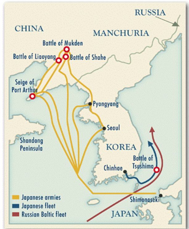
De Russisch-Japanse Oorlog

lichaam. We bekeken haar genitaliën, overgoten haar met olie en staken haar lichaam in brand.” 4