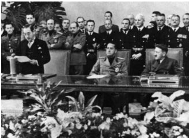
Ondertekening Tripartite Pact, 27 september 1940

De Amerikaanse 'Pacific Fleet' werd in april 1940 grotendeels verplaatst van de Amerikaanse westkust naar Hawaï. Formeel in het kader van een oefening, maar de vloot keerde niet terug. Hiermee werd een duidelijke boodschap aan Japan afgegeven.