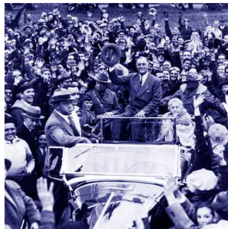
Roosevelt op de verkiezingsdag, 5 november 1940

Najaar 1940 vonden in de VS verkiezingen plaats. De Republikeinen kozen de ‘isolationist’ Wilkie als kandidaat. Roosevelt werd in de campagne beschuldigd van oorlogshitserij omdat hij in september snel een aantal maatregelen had doorgevoerd. De dienstplicht werd ingesteld en enkele miljarden werden vrijgemaakt voor de bouw van marineschepen en andere militaire zaken. Opiniepeilingen uit die tijd geven aan dat tot 90% van de geënqueteerden mordicus tegen een oorlogsverklaring aan Duitsland was. 18 Roosevelt zag zich genoodzaakt ‘geen buitenlandse oorlogen’ te beloven en won met 55% van de stemmen; een stuk minder ruim dan zijn twee voorgaande verkiezingsoverwinningen. Desalniettemin wierp hij zich in de ‘State of the Union’ van 6 januari 1941 op als voorvechter van een vrije wereld. 19 In Japan wist men dat met Roosevelt’s herverviering de huidige handelsmaatregelen niet van de baan waren en misschien wel een totale olieboycot in het verschiet lag. Intern vonden in Tokyo felle debatten plaats tussen hardliners en gematigder beleidsmakers.