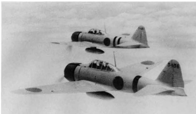
De Mitsubishi Zero was in 1941 superieur qua wendbaarheid, snelheid en multi-inzetbaarheid

Tegelijkertijd greep Japan de gelegenheid aan om tussenbeide te komen bij de al weken voortslepende schermutselingen in Indo-China tussen Franse en Thaise troepen. (Thailand claimde stukken van Cambodja en Laos.) Op 30 januari vond openlijk machtsvertoon plaats van de Japanse vloot voor de zuidkust van Vietnam. In Saigon werd onder 'bemiddeling' van Japan een vredesovereenkomst tussen Vichy-Frankrijk en Thailand ondertekend.