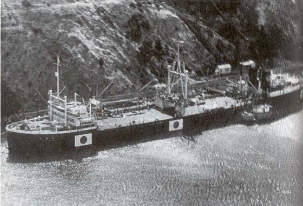
Voorjaar 1941 De Japanse olietanker Nisshin Maru wordt volgepompt in Porta Costa, Californië