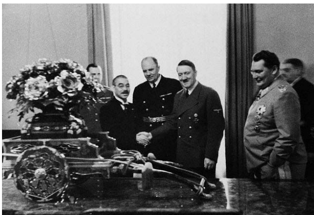
Maart 1941, Matsuoka geeft Hitler een cadeau, alvorens de aanval op Singapore ter sprake komt

bleek dat Hitler niet geheel open kaart speelde met Matsuoka, maar wel tussen de regels door zijn plannen liet doorschemeren. Boeiend vind ik dat je eruit kan opmaken dat Hitler bij de aanval op de Sovjet Unie, operatie Barbarossa, op een tweede front tegen Stalin hoopte.