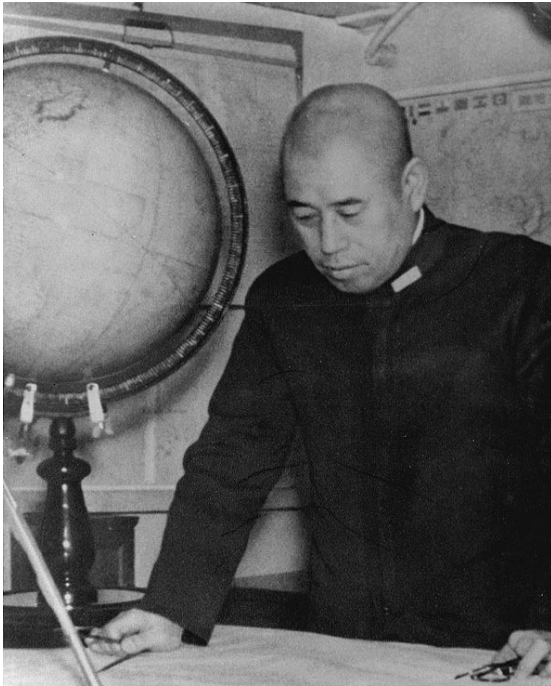
Admiraal Isoroku Yamamoto, najaar 1940

Beziet men de hiervoor geschetste gebeurtenissen sinds 1939, dan is het al een aardige exercitie om je af te vragen wanneer de VS nu op Japanse maatregelen reageren en wanneer het omgekeerde het geval is. Dat de Japanners zenuwachtig worden van een dreigend gebrek aan olie, moge duidelijk zijn.