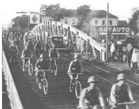
Juli 1941, Japanse soldaten trekken Saigon binnen

Roosevelt sprak het Amerikaanse volk toe op 4 juli, de nationale onafhankelijkheidsdag. Hij refereerde aan de basis van de Amerikaanse natie van 1776 en vervolgde: “Ik wil het Amerikaanse volk nadrukkelijk zeggen dat de Verenigde Staten nooit als een gelukkige en welvarende oase van vrijheid kunnen voortbestaan temidden van een woestijn van wrede dictatuur.” 19