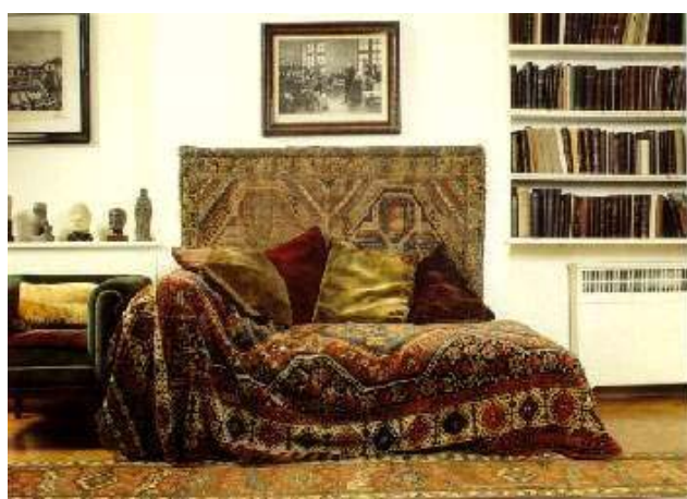
De beroemde sofa van de Weense arts en psychiater Sigmund Freud (1856-1939) Vanaf deze plek werd menige reis naar het onderbewuste ondernomen.