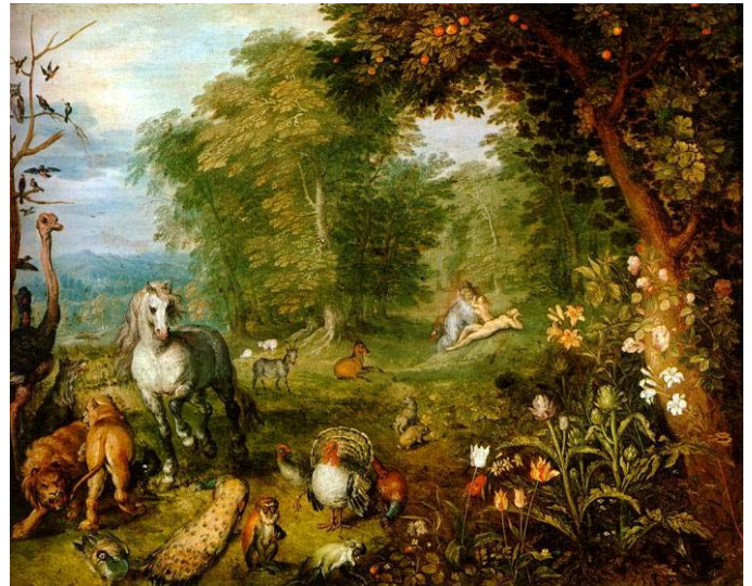
Het paradijs van Jan Brueghel den Oudere (ca.1600)