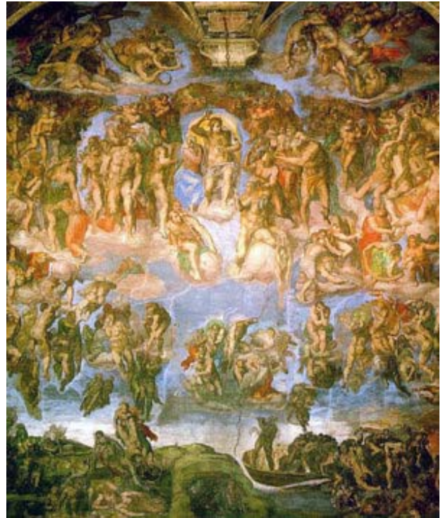
Boven-midden- en onderwereld bijeen tijdens het 'Laatste Oordeel' van Michelangelo Buonarroti (1475-1564)

overledenen wonen, die gelijkwaardig zijn geworden aan deze hogere wezens. Ook tegenwoordig spreken we nog over deze werelden, maar we zien ze vanuit nieuwe begrippen als verschillende bewustzijnslagen. Naast het gewone, wakkere dagbewustzijn, dat het midden vertegenwoordigt, onderscheiden we een onderbewustzijn en een hoger bewustzijn.