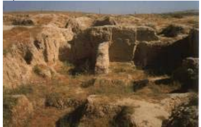
De ruïnes van Afrasiab

Hij leefde als een hond en groeide op als een hond. Hij lag buiten aan de ketting, at bedorven v lees, had het ijskoud in de winter en wenste dat hij dood was. Maar dat bleef hem bespaard. Hij bleef leven.