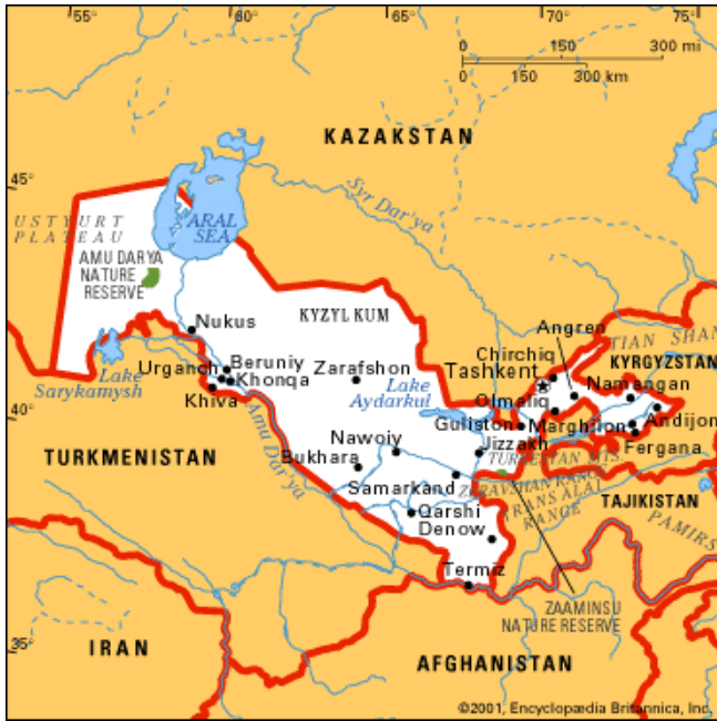
Samarkand ligt in Oezbekistan