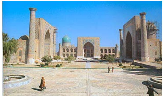
Het 'nieuwe' Samarkand: centrum van het rijk van Timoer Lenk (1336-1405)