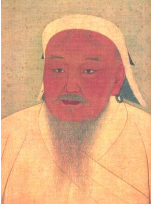
Djingiz Khan (ca 1161-1227)

Toch kreeg hij nog een kans, net als Alexander. Hij zag een vrouw, een van de weinige vrouwen die nog in leven waren. Ze was een jong meisje dat in een shocktoestand op de grond zat. Haar familie was vermoord, haar huis was platgebrand. Haar gouden stad bestond niet meer. Maar de dood had haar nog niet opgeëist en ze wist niet wat haar lotsbestemming zou zijn.