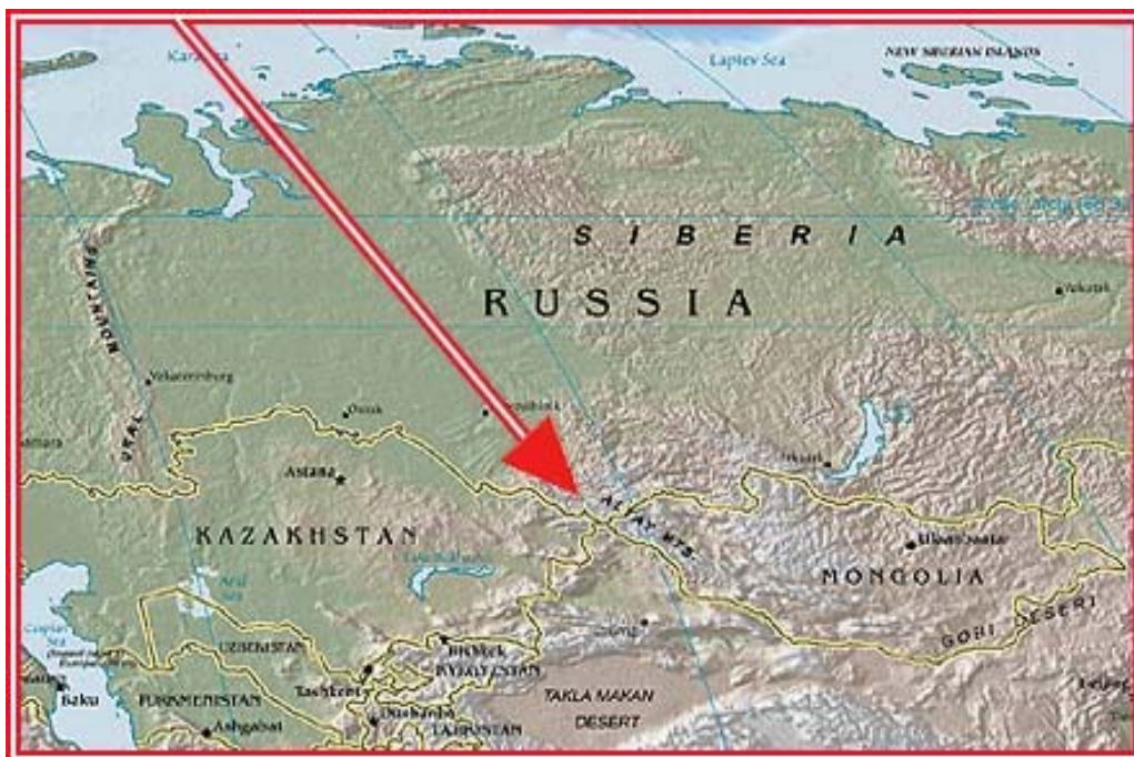
Het Altai-gebergte ligt in Rusland en Mongolië

(Passages uit: 'Het pad naar de sjamaan', Bruna- pocketuitgave, blz 188-203)