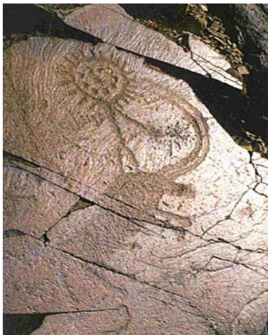
Oeroude rotstekening uit Tamgaly. Sjamanen werden afgebeeld met de zon op de plaats van het hoofd.