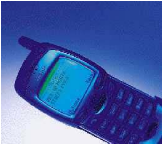
Telecommunicatie: de overheid als moderne ondernemer

werktijden, waar tegenover staat dat ze moeten toelaten dat de overheid de internationale verplichting op zich heeft genomen om economische posities in een open onderhandelingsronde te veilen. 14 Het curieuze is dat de overheid daarmee een nieuwe rol als ondernemer heeft gekregen. Bijvoorbeeld de gemeente Amsterdam, die het kabelnet aan de hoogste bidder heeft verkocht, UPC, met enkele prijsvoorwaarden en garanties voor toegankelijkheid van een breed TV-pakket. Inkomsten voor de gemeente: 100 miljoen Euro, die daar weer leuke dingen mee kan gaan doen op de welbekende wijze ten algemene nutte. UPC heeft de kabel(positie) en zal trachten dat geld er weer uit te slepen op kosten van de gebruiker. (Voor UPC is dit overigens op haar beurt een riskante strategie gebleken. Zie ook de schade met bijkomende massa ontslagen die de hoge kosten van de veiling van UPS-frequenties in Duitsland en Nederland aan KPN-Telecom heeft toegebracht.)