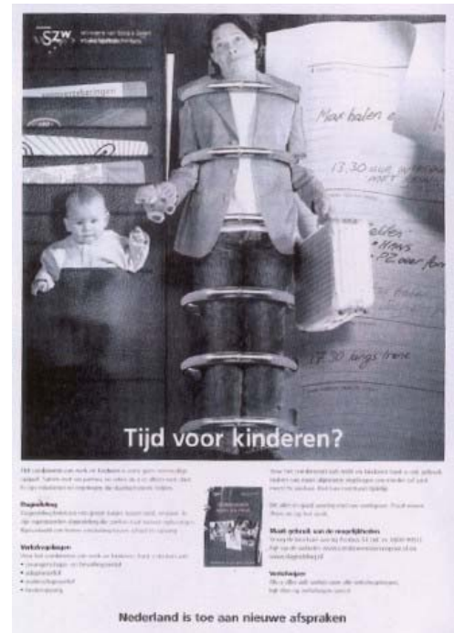
Campagne Ministerie SZW uit het jaar 2000

een trein zitten, maar beduidend meer, zoals b.v. in het onderwijsbolwerk in Zoetermeer.