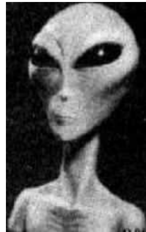
Een typische 'grote grijze'

Hier houden de zaken echter niet mee op. Er zijn zeldzamere waarnemingen, die verontrustender zijn. Deze waarnemingen komen, voor zover mij bekend, alleen voort uit hypnose. Dit is natuurlijk een probleem, wat in meerdere opzichten veelzeggend is: met wakker ik-bewustzijn vallen deze wezens nauwelijks waar te nemen. Er zijn hagedisachtige types, die iets woest, vurigs hebben en tegelijkertijd zeer kil. Ze worden niet als bestuurders van Ufo's waargenomen, maar meer als een soort werkers in 't veld of in klaarblijkelijke Ufo-bases. Deze wezens hebben wél pupillen; geel, met groene ogen.